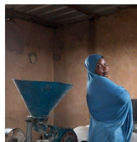
Al Níger, elles trien del 22 de febrer al 5 de març

Des del 22 de febrer fins al 14 d'abril, podem gaudir d'un cicle d'exposicions al Casal de Cultura en l'horari d'obertura de la Biblioteca. Totes són gràcies a la col·laboració de l'Ajuntament amb el Fons Mallorquí de Solidaritat.