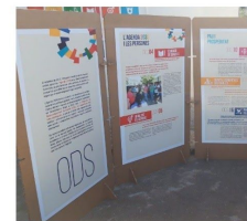
Agenda local 2030 del 5 al 19 de març